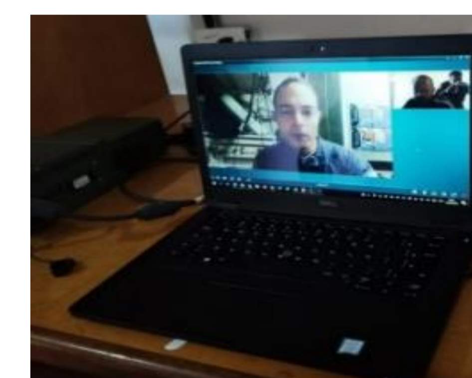
Fig. 5 – Streaming de vídeo