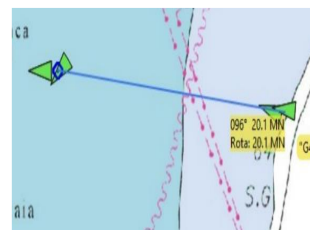
Fig. 3 – Alcance máximo