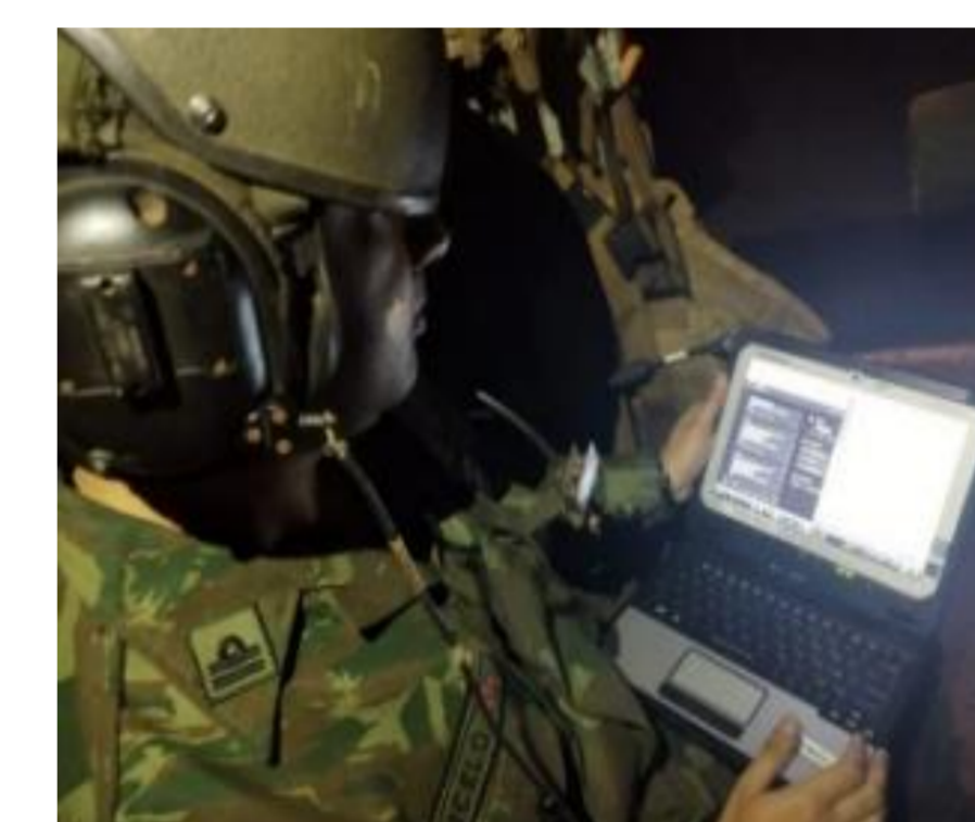
Fig. 4 – Comunicação do CLANf